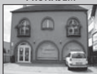
KN 11011 Obchodní prostory

Nabízíme k pronájmu obchodní prostory v Břeclavi o vým. 140m 2 včetně kanceláře.