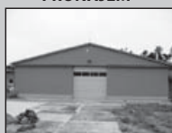
KN 11009 Objekt v MÜNĚ

Nabízíme k pronájmu nově vybudovanou halu včetně dvou kancelářů, soc. zařízení a pozemku.