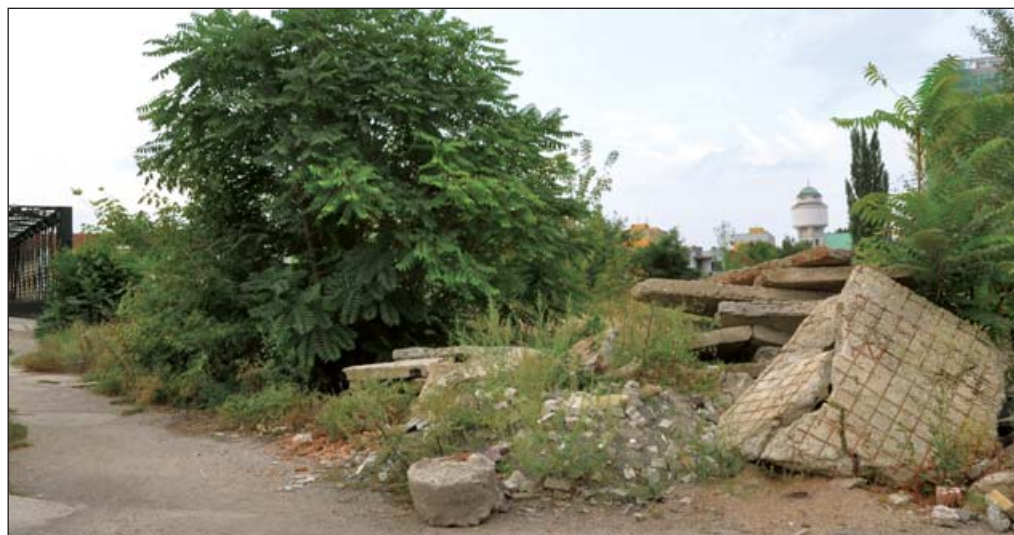
Nevzhlednou suť zanedlouho nahradí kopec pro sáňkaře a bikery.

i po bezpečnostní stránce a nehrozilo tak, že by se děti zranily o nějaký trčící předmět. Do konce roku by vše mělo být hotovo. S prvním sněhem by proto už děti mohly mít plochu k zimním radovánkám přímo v centru města,“ doplňuje. (dav)